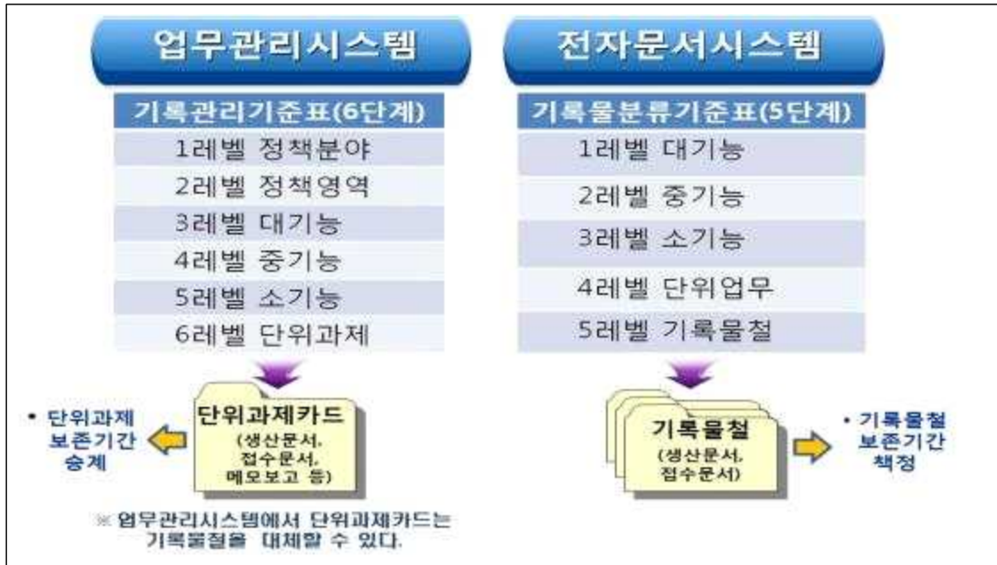
그림 1 - 전자기록생산시스템의 분류 및 편철

분류는 논리적으로 구조화된 방식과 규칙에 따라 업무 행위나 기록물을 조직화하여 체계적으로 관리·활용하기 위한 업무 절차이다. 공공기관은 업무 과정이 반영될 수 있도록 분류체계를 마련하고 기록물관리에 활용하여야 한다.