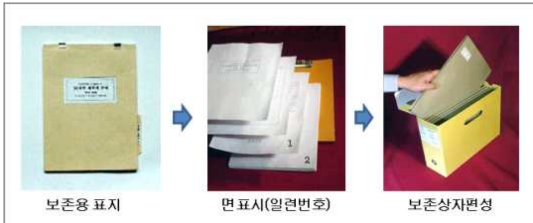
그림 2 - 비전자기록물 편철 및 보존상자 편성 요령