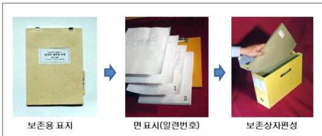
그림 2 - 비전자기록물 편철 및 보존상자 편성 요령

비고 비전자기록물의 편철과 관련한 상세한 사항은 중앙기록물관리기관에서 매년 배포하는 “기록물 관리지침”을 참조한다.