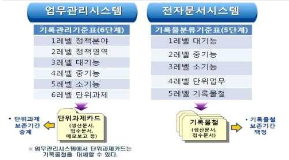
그림 1 - 기록생산시스템의 분류 및 편철

직화하여 체계적으로 관리·활용하기 위한 업무 절차이다. 공공기관은 업무 과정이 반영될 수 있도록 분류체계를 마련하고 기록물관리에 활용하여야 한다.