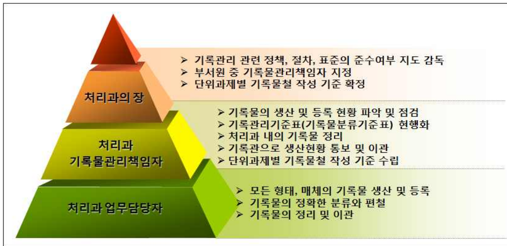
그림 1 - 처리과 기록관리 업무 분장 개념도

업무담당자는 업무 수행과정에서 생산·접수한 기록물을 빠짐없이 등록, 분류·편철, 정리하여야 하며, 처리과 기록물관리책임자의 요청에 따라 기록관으로 이관하기 전까지 기록물을 안전하게 보관하여야 한다.