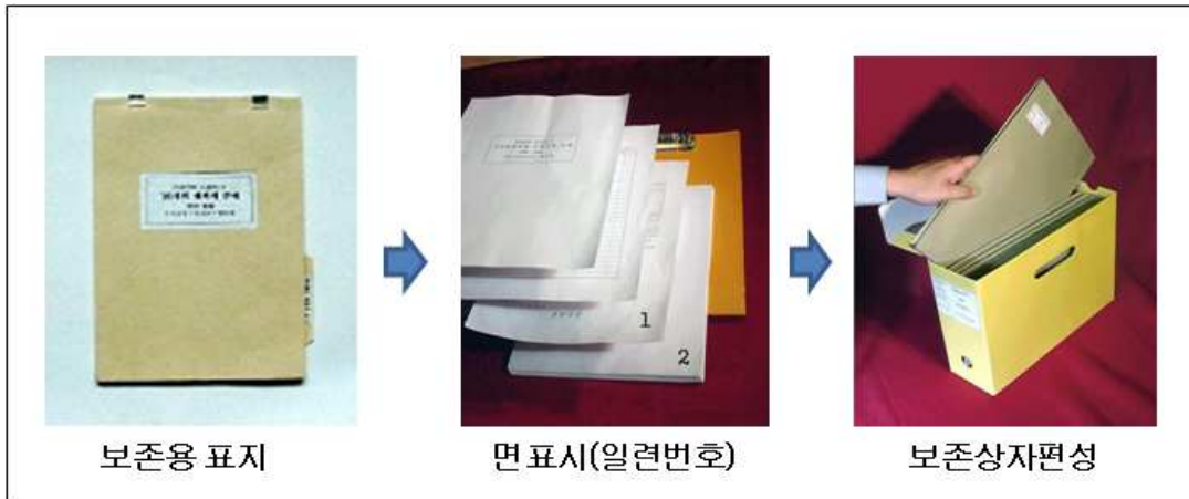
그림 2 - 비전자기록물 편철 및 보존상자 편성 요령

비고 편철과 관련한 상세내용은 기록관리 표준인 "NAK/G 3:2007(v1.0) 기록물 정리 및 이관지침" 1.1.6과 1.1.7을 참조