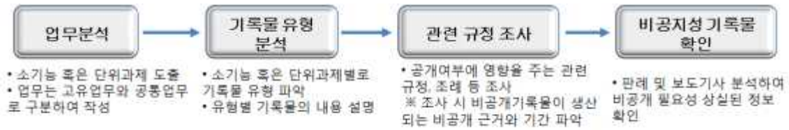
그림 2 - 기록물 공개재분류 기준서 작성 절차도

a) 공개재분류 기준을 작성하기 위하여 우선 기관의 전반적인 업무 분석을 통해 소기능 또는 단위과제를 도출한다. 업무는 고유 업무와 공통 업무로 구분·작성하고 고유 업무의 경우 수행부서를 함께 파악하여 업무개요를 기술한다. 기존에 기관의 업무분류체계가 있는 경우 이를 활용할 수 있다.